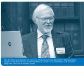
Prof. Dr. Wolfgang Betsch bei der Aufnahme. The Chairholder of the Center for International Law and Human Rights, German Institute of International Law and Human Rights

Das Thema der Völkerverträge ist ein zentraler Bestandteil der UN-Agenda 2030 für nachhaltige Entwicklung (SDG) und wird im Rahmen der Agenda 2030 durch die verschiedenen Nachhaltigkeitsziele (SDGs) adressiert. Die Agenda 2030 zielt darauf ab, die Lebensqualität aller Menschen zu verbessern und die Ungleichheiten zu beseitigen. Die Agenda 2030 ist ein zentraler Bestandteil der UN-Agenda 2030 für nachhaltige Entwicklung (SDG) und wird im Rahmen der Agenda 2030 durch die verschiedenen Nachhaltigkeitsziele (SDGs) adressiert. Die Agenda 2030 zielt darauf ab, die Lebensqualität aller Menschen zu verbessern und die Ungleichheiten zu beseitigen.