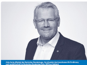
Alois Gerig, Mitglied des Deutschen Bundestages, Vorsitzender des Ausschusses für Ernährung und Landwirtschaft im Deutschen Bundestag

Dass im Jahr 2021 Menschen hungern müssen, ist ein Skandal. Daher steht im Mittelpunkt der Agenda 2030 das Versprechen Armut, Hunger und Fehlernährung in all ihren Formen zu bekämpfen. Zu wenig Menschen haben Zugang zu ausreichend bezahlbarem, sicheren und gesunden Lebensmitteln. Weltweit können sich etwa drei Milliarden Menschen keine gesunde Ernährung leisten. Das ist keine hinnehmbare Situation. Dabei waren wir auf einem guten Weg. Nach erfolgreichen Jahren mit sinkenden Zahlen der von Armut und Hunger Betroffenen zeichnet sich nun ein düsteres Bild ab: Die Corona-Pandemie wirkt wie ein Bremsgas auf den Hunger in der Welt. Die bestehenden Probleme werden verschärft. Hier ist es unsere PFLICHT, Verantwortung zu übernehmen und den Hunger weltweit zu bekämpfen.