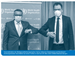
Generaldirektor der Weltgesundheitsorganisation Tedros Adhanom Ghebreselassie und Bundesminister Gerd Müller bei einem Treffen in Genf am 29. März 2021

Gesundheit ist ein Menschenrecht Seit 1978 berechtigt Gesundheit ein Menschenrecht. Die Pläne, dieses Recht umzusetzen, hat die internationale Gemeinschaft längst entwickelt – nachzulesen in der „Primary Health