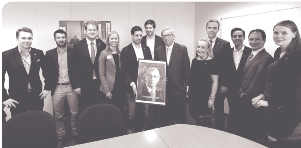
Präsident der Europäischen Kommission Jean-Claude Juncker mit jungen Engagierten

Engagement für Entwicklungsfragen hat eine lange Tradition in Europa. Europa ist nicht nur in der staatlichen Entwicklungszusammenarbeit weltweit klar führend. Wohl nirgendwo sonst gibt es außerdem eine derart hohe Anzahl von nicht-staatlichen Organisationen und Privatpersonen, die sich für Armutsbekämpfung in Entwicklungs-